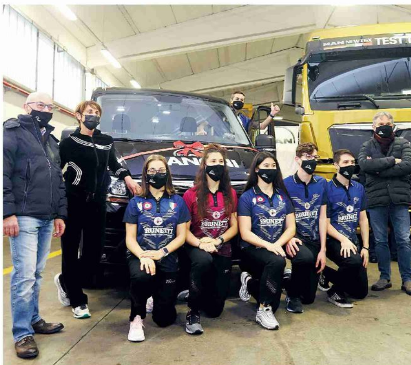
Gli atleti della Brunetti e il nuovo pulmino Man