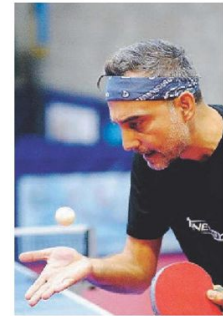
TORNEO Di Cataldo del Barletta

risultato a Casamassima, inutile nascondere, sarebbe per loro due una bella iniezione di fiducia in vista del rush finale nel campionato a squadre di serie C2».