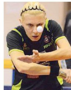
Atleta. Ha vinto ben 18 scudetti

La campionessa di Castel Goffredo ora gestisce «Al Ceppo» di Desenzano