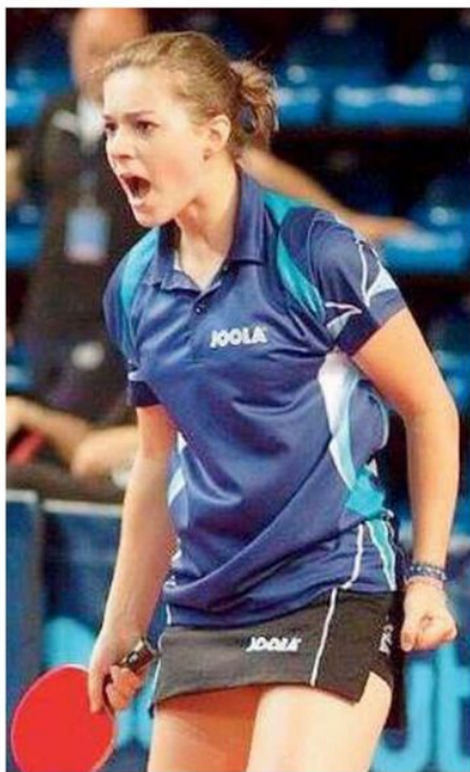
Che grinta. La campionessa di tennistavolo