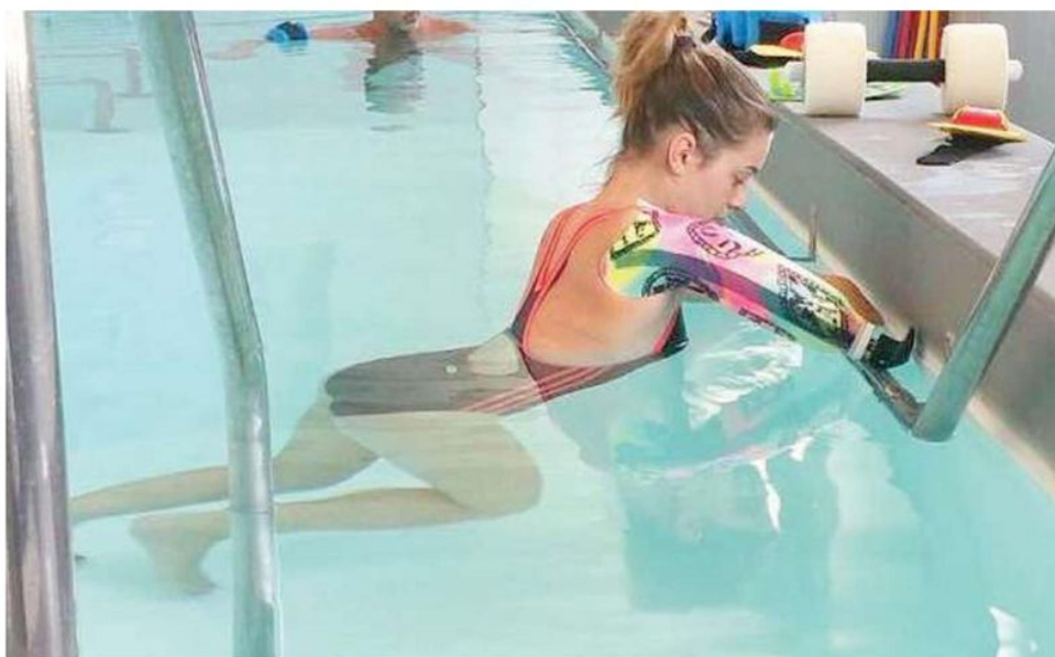
Avanti tutta. Lo sport ha aiutato tantissimo la giovane ad affrontare le conseguenze dell'incidente in moto