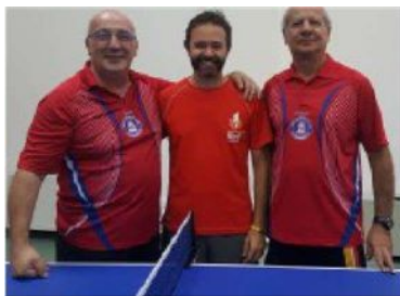
GLI ATLETI DEL TENNIS TAVOLO ROSSO