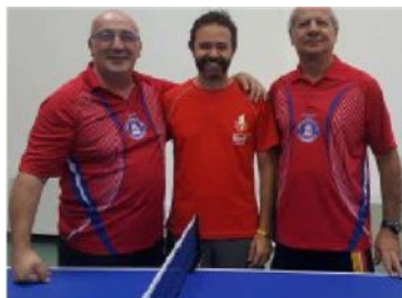
GLI ATLETI DEL TENNIS TAVOLO ROSSO