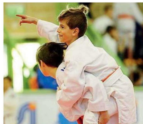
Piccoli judoka crescono. Atleti in gara