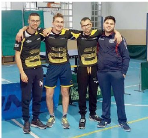
LA COMPAGINE DEL «MODICA CARTELLONE»