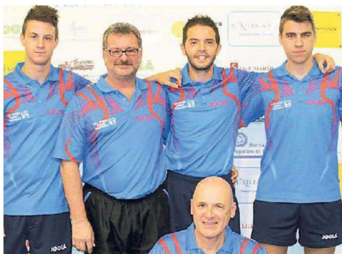
Apuania sugli scudi in serie A1