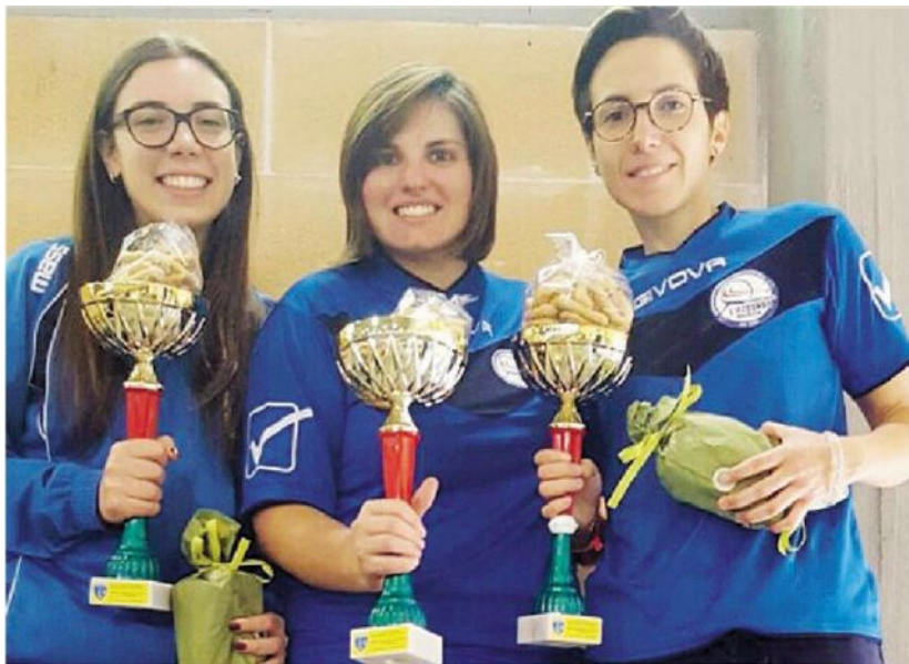
TRIO DELLE MERAVIGLIE Le ragazze dell'Azzurro Molfetta