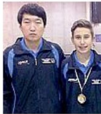
Qin e Pet