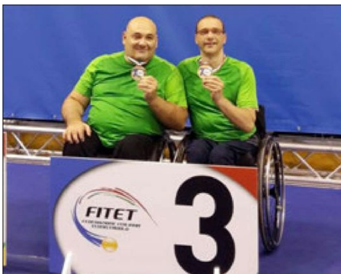
Il podio dei Giovanissimi

Sono arrivate grandi soddisfazioni nella rassegna piemontese per i nostri portacolori