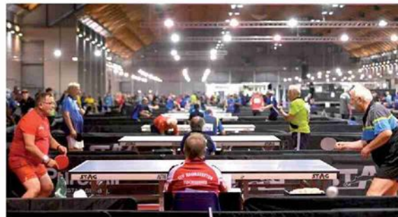
Una fase di gara degli Europei Veterani di Rimini