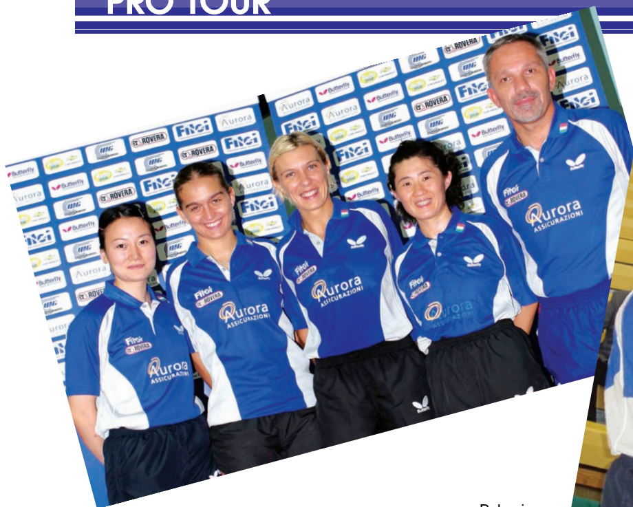
La nazionale femminile