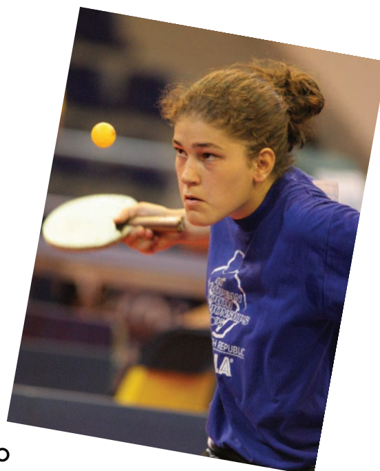
La ricchezza del tennistavolo italiano nelle immagini dei tanti protagonisti dei campionati individuali 2006